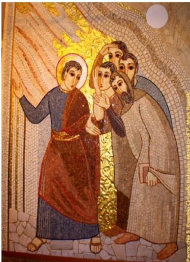
Venite a me, voi tutti che siete stanchi e oppressi, e io vi darò ristoro (Mt.11,28)

Fra non molti giorni alcune sorelle e alcuni fratelli busseranno alla tua porta in nome di Gesù, che ti dice: Ecco io sto alla porta e busso. Se mi apri, ti darò il libro della vita e ti insegnerò il timore del Signore.