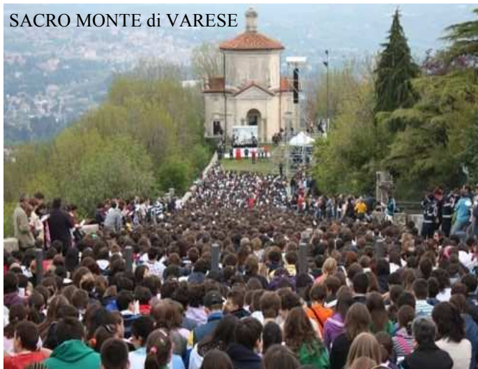
SACRO MONTE di VARESE

Bene, proviamo a rispondere. La professione di fede è un segno cristiano che viene proposto ai ragazzi di prima superiore dopo un cammino di catechesi post cresima. E' una chiamata ad essere testimoni che fede e vita sono una cosa sola, che una non esclude l'altra ma anzi la completa e la rende piena. Significa dare una prima adesione personale alle parole che ogni domenica ripetiamo nella preghiera del Credo, rinnovando la propria scelta e confermando ciò che si è ricevuto e imparato durante gli anni della catechesi di iniziazione. Per non cadere nel pericolo di lasciare questa esperienza in un mondo astratto e lontano dalla vita quotidiana è stato proposto ai ragazzi un campo di lavoro in oratorio nei giorni del 15 e 16 ottobre con momenti di preghiera e riflessione, lavori pratici di manutenzione per il nostro oratorio, condivisione fraterna durante i pasti, la notte insieme e la messa domenicale con la comunità. Questa esperienza ci ha permesso di fare memoria che ciascuno è chiamato così com'è a essere parte viva della Chiesa, discepolo alla ricerca di una relazione vera con il Padre e capace di dare un senso, e non solo uno scopo, alla propria vita.