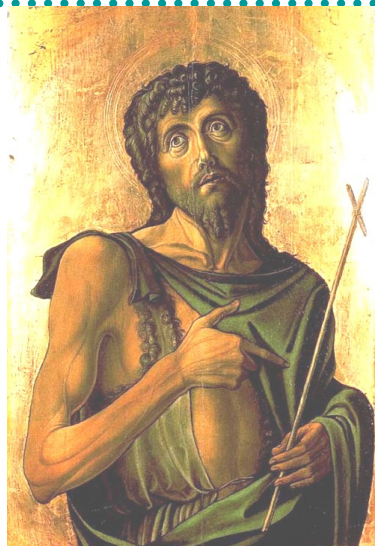
Alvaro Vivarini, S. Giovanni Battista, 1475, Museo Thyssen-Bornemisza, Madrid