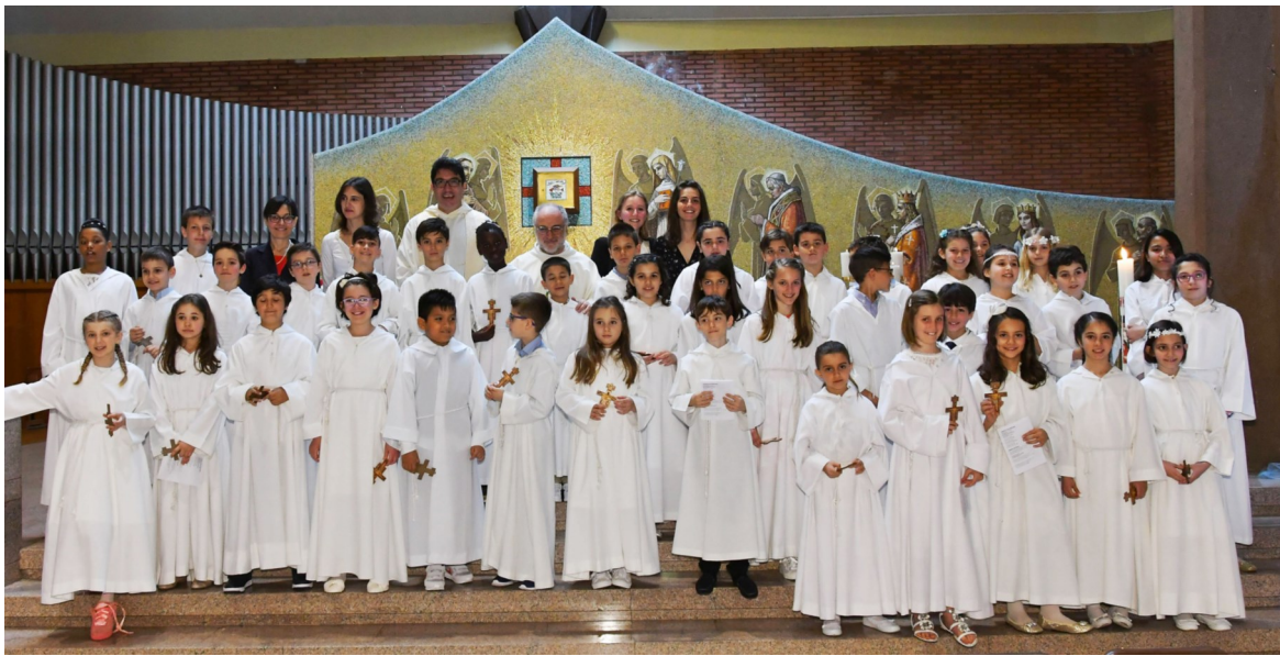
I BAMBINI DELLA PRIMA COMUNIONE