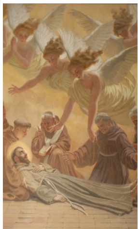
Transito di S. Francesco La Porziuncola